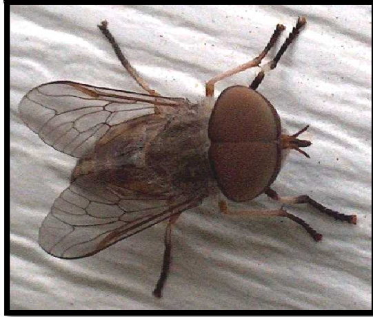
مگس‌های خونخوار منتقل‌کننده ویروس کم‌خونی عفونی اسب