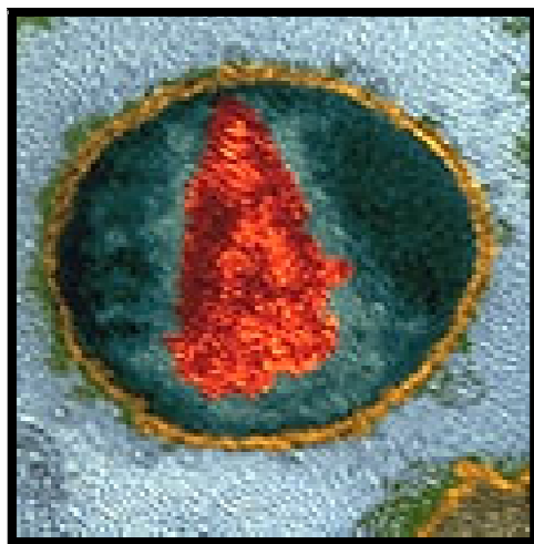
تصویر میکروسکوپ الکترونی از ویروس کم خونی عفونی اسب

عامل کم خونی عفونی اسب، ویروسی از جنس لنتی ویروس ۳ در خانواده رتروویریده ۴ می باشد.